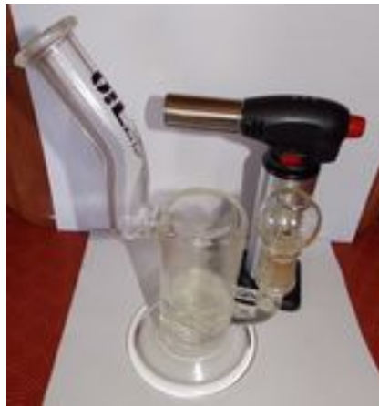
Bubbler et chalumeau