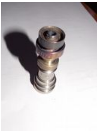
Clou en titane grade 2